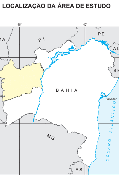
LOCALIZAÇÃO DA ÁREA DE ESTUDO